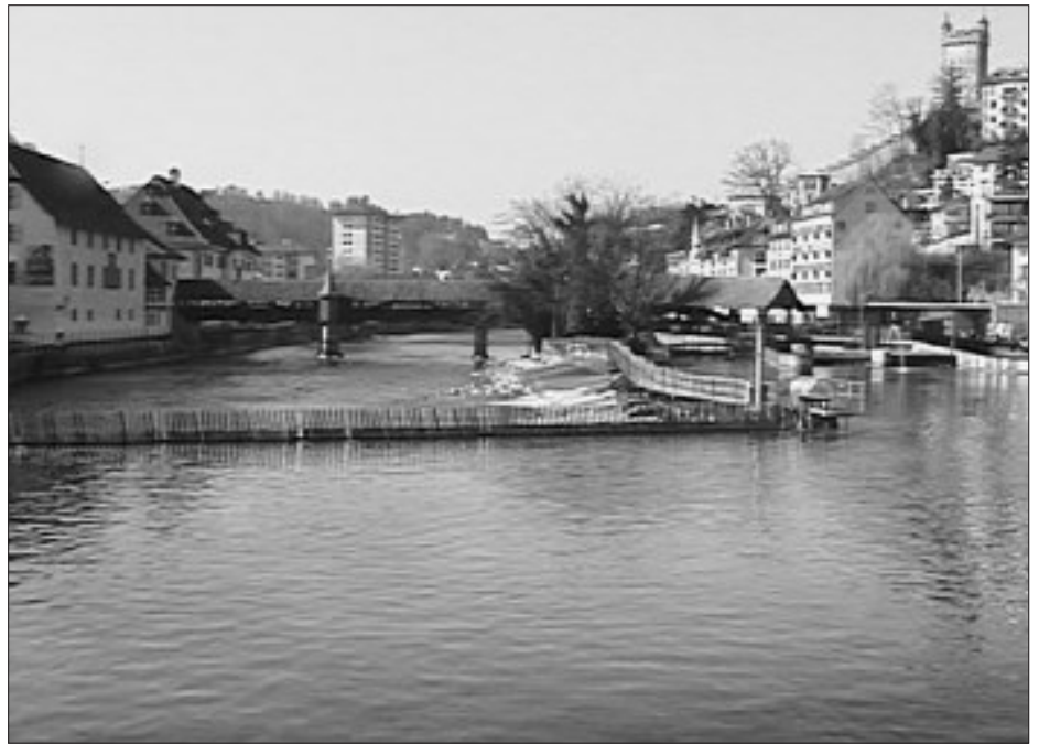
Das Reusswehr am Mühlenplatz

Das Nadelwehr in Luzern ist technikgeschichtlich einzigartig. Das sogenannte System Poirée wurde