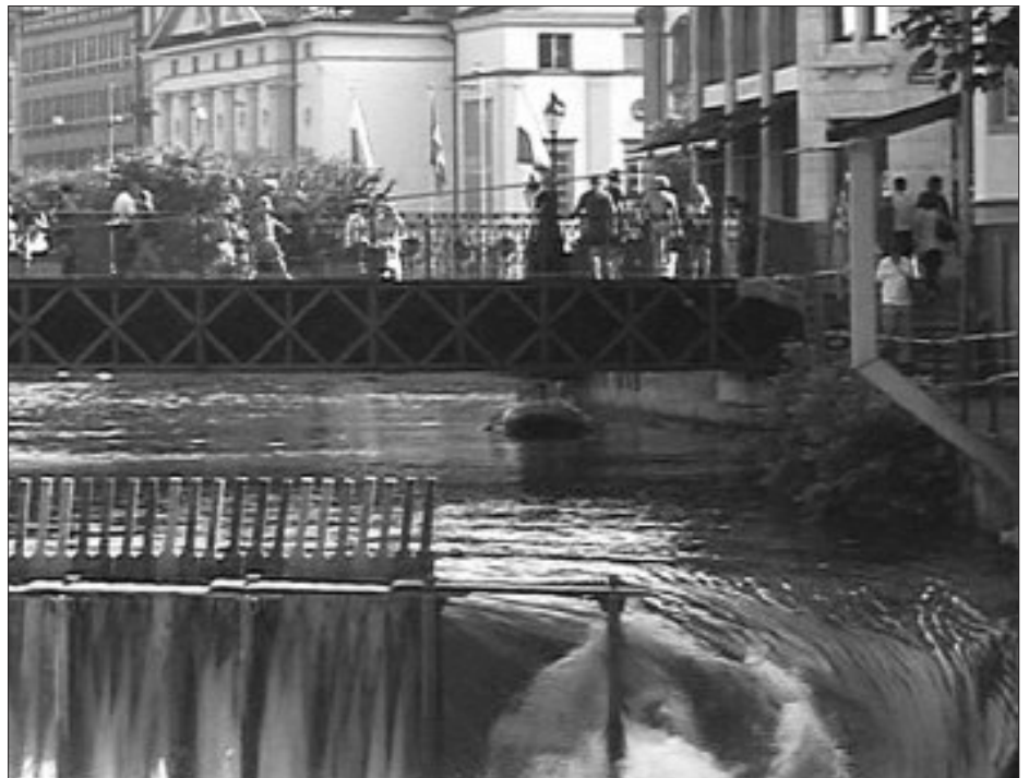
Das Nadelwehr – zur Hälfte geöffnet