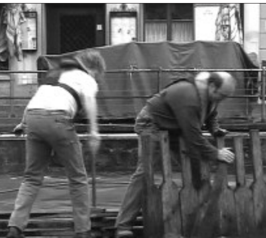
Die Mitarbeiter vom Zimmerwerk müssen schnell handeln