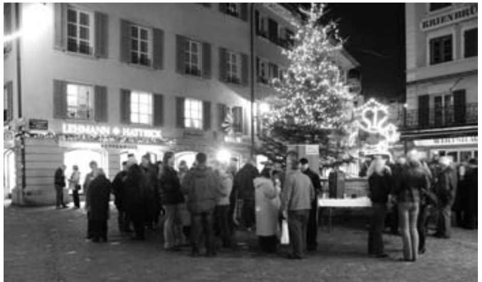
Apéro zur Eröffnung Krippenausstellung

Die Zusammenarbeit des Quartiervereins Kleinstadt mit der Schweizerischen Vereinigung der Krippenfreunde und dem Vkbfs trägt wunderbare Früchte. Glanzlichter dieses einmaligen Kulturgutes sind in den Schaufenstern der Kleinstadt noch bis Ende Monat zu sehen. Gleichzeitig tauchen die Gassen in ein prächtiges Lichtermeer. Seit 1959 bringt die Kronenbeleuchtung vorweihnächtliche Stimmung. Alljährlich beweisen die Geschäfte des Quartiers Kleinstadt, dass gemeinsames Einstehen für eine gute Sache möglich ist. In anderen Quartieren der Innenstadt ist man von solchem Gemeinsinn weit entfernt. Neu sind heuer die drei Kronen in der Rütligasse. Der ALI-Fonds (Fond zur Attraktivierung der Luzerner Innen-