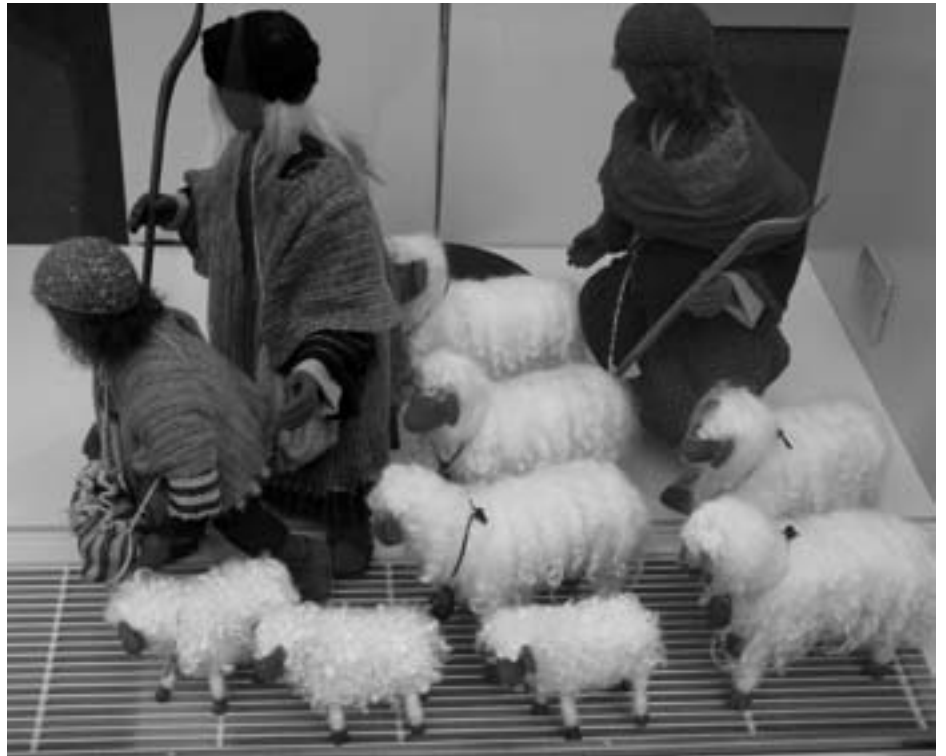
«Hirten lagerten auf freiem Felde» (hier im geheizten Schaufenster, bei Lichtformat)