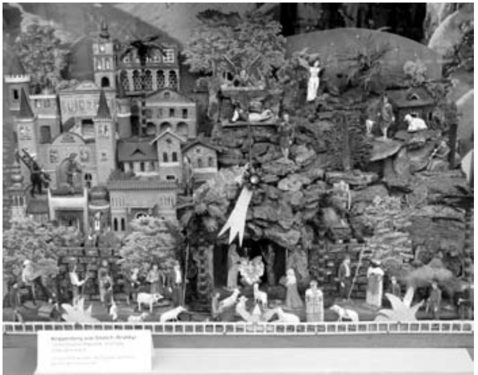
Krippenberg aus Grulich, bemalte Holzfiguren, um 1900 (in der Safran Drogerie)

Eine Augenweide der Ausstellung ist auch die älteste ausgestellte Krippe: die mit Seide überzogenen Wachsfigürchen stammen aus der 2.