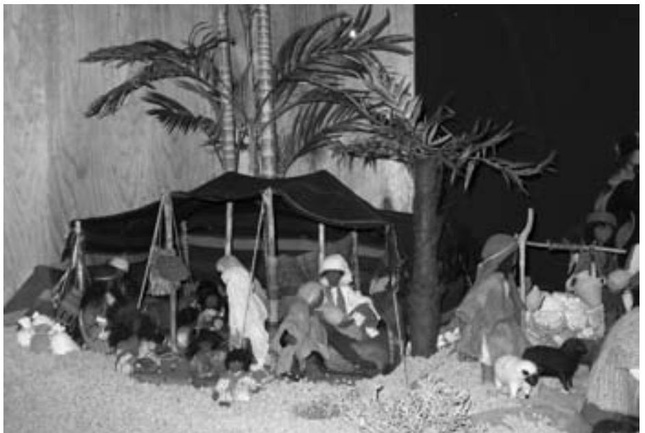
Mit viel Liebe zum Detail werden ganze Geschichten erzählt (bei von Moos Sport und Hobby)