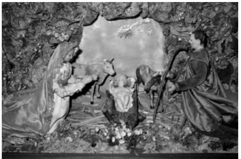
Ein Bijou aus dem 18. Jahrhundert (im Nix's in der Laterne)

Neben den verschiedensten Krippen aus Italien, Deutschland, Frankreich, der Schweiz usw. bilden die Krippen der Vereinigung Kursleiterinnen