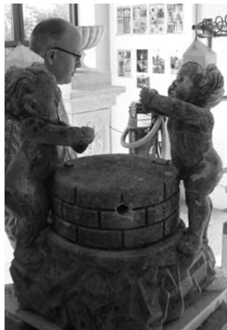
Die Umwelt hat den Brunnenfiguren beim Krienbrüggli arg zugesetzt.