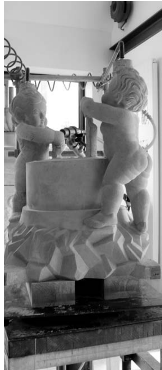
Beim Steinmetz Vitus Wey in Sursee entsteht etwas Neues.