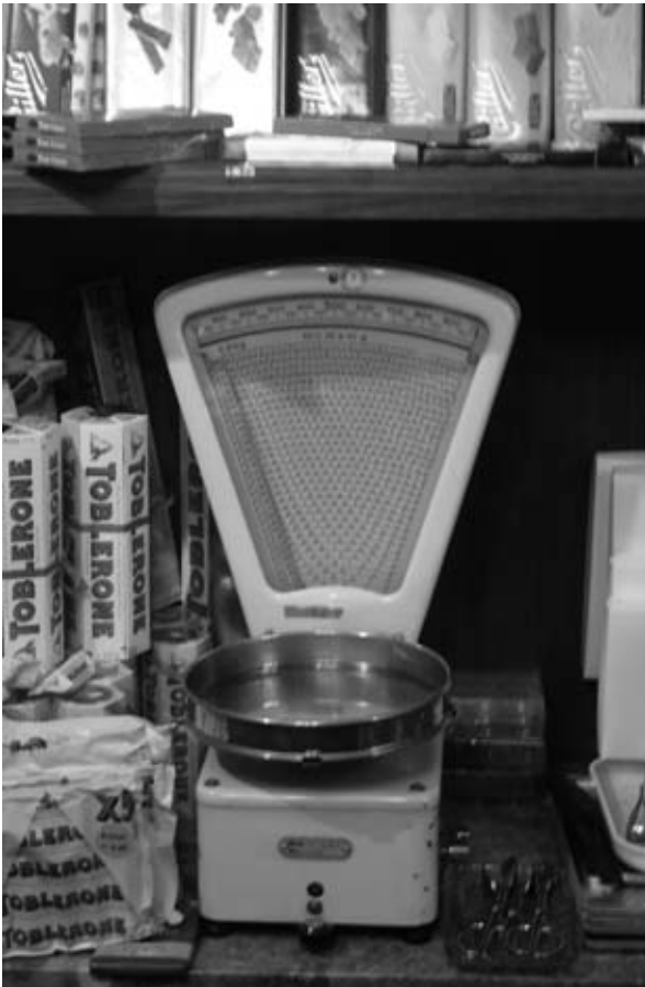
Dörfs es bitzeli meh si?