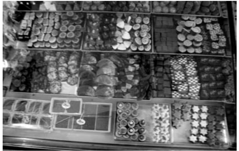
Die Welt der Pralinés. Viel mehr hat da nicht mehr Platz