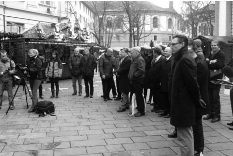
Die ersten 'Kunden' sind da!