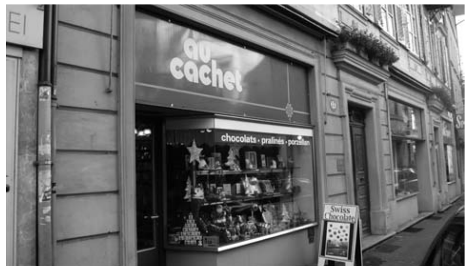
Au Cachet an der Pfistergasse

Sie ist eine wunderbare Verkäuferin. Während an den Schulen den Kids eingetrichtert wird, Süsses zu meiden, mehr Früchte und Gemüse zu essen und Sport zu treiben, ist ‚Schoggi-Susi‘ von der glücklich machenden Schokolade überzeugt. Sie sagt es mit einem Lächeln und spitzbübischem Blick, man kann