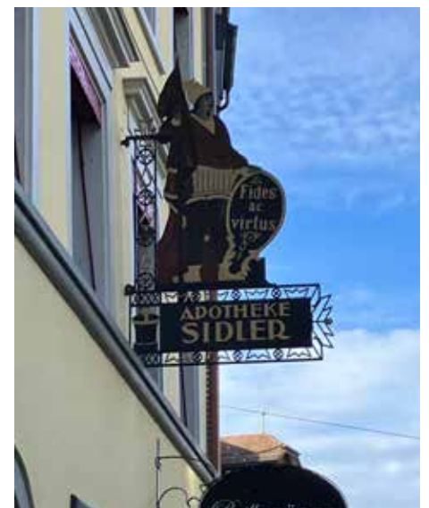
Das alte Apotheken-Schild hängt seit ein paar Monaten wieder an der Fassade.