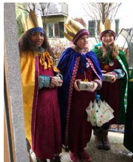
Bald gehen die Sternsinger wieder von Tür zu Tür.

https://www.missio.ch/kinder-und-jugend/kampagne-2025