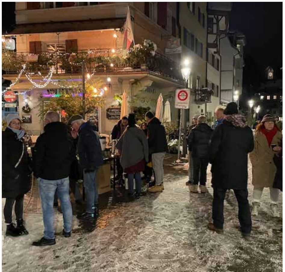
Der Adventsapéro lockte viele auf den verschneiten Philipp-Anton-von-Segesser-Platz.

Mit Glühwein und Kuchen hiessen sie den Advent willkommen. Viele Mitglieder nutzten den Anlass für ein geselliges Beisammensein, und die Passanten freuten sich über das unerwartete Angebot.