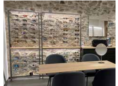
So präsentiert sich das neue Ladenlokal von Pfistergass-Optik.

ben. Während drei Wochen wurden neue Elektroleitungen in den Boden gelegt, ein neuer Boden und neue, beleuchtete Brillenregale wurden eingebaut. Darüber hinaus gab's auch neue Sessel, neue Stühle und einen neuen Empfangs-Tisch. Dem Umbau, der Anfang Dezember fertig war, war eine rund halbjährige Planungsphase vorausgegangen. Als Dankeschön an die Kundinnen und Kunden sowie zur Feier der Neuerung veranstaltete Pfistergass-Optik am 7. Dezember ein Konzert.