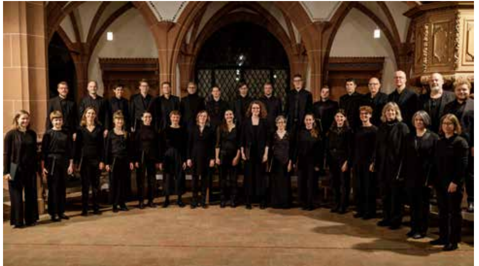
Das Collegium Vocale tritt in der Franziskanerkirche auf.

Das Werk wird am 24. und 25. Mai jeweils in der akustisch ideal für barocke Chor- und Orchestermusik geeigneten Luzerner Franziskanerkirche aufgeführt. Tickets können im Vorverkauf oder an der Abendkasse erworben werden.