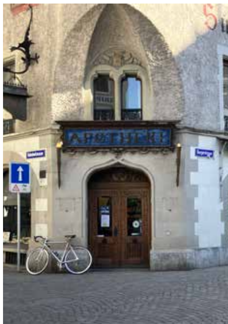
Die Alte Suidtersche Apotheke rüstet sich für die Zukunft.

Ein erweitertes Dienstleistungsangebot steht ebenso zur Verfügung wie verschiedene Messungen wie Langzeit- und Kurzzeitblutzucker, Blutfette, akute Entzündungen sowie Blutdruck. Wie bis anhin bietet die Alte Suidtersche Apotheke eine Reihe von Geräten zum Mieten an und führt verschiedene Impfungen durch.